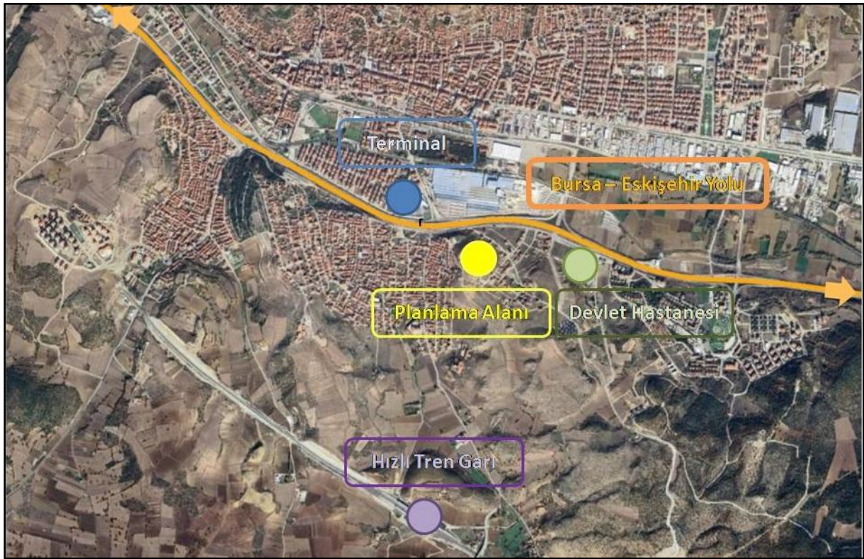
Şekil 1 Planlama Alanının Konumu

Planlama alanı, Bursa-Eskişehir yolunun yaklaşık 225m güneyinde, Bozüyük hızlı tren garının yaklaşık 1550m kuzeyinde, Bozüyük otobüs terminalinin yaklaşık 340 m güneydoğusunda ve Bozüyük Devlet Hastanesinin yaklaşık 470m batısında konumlanmaktadır. Kurtuluş Savaşı ve İnönü Zaferleri Anı Evi ve Seyir Terasının güneyinde bulunmaktadır.