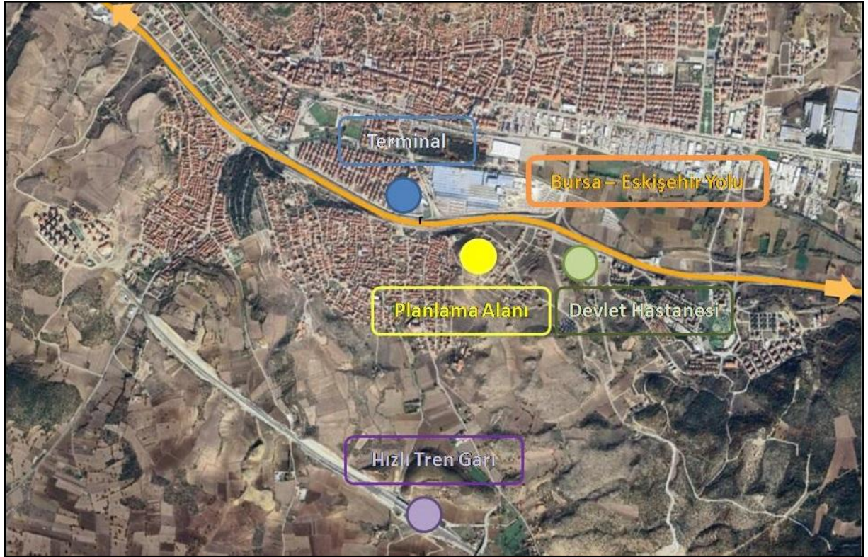
Şekil 1 Planlama Alanının Konumu

Planlama alanı, Bursa-Eskişehir yolunun yaklaşık 225m güneyinde, Bozüyük hızlı tren garının yaklaşık 1550m kuzeyinde, Bozüyük otobüs terminalinin yaklaşık 340m güneydoğusunda ve Bozüyük Devlet Hastanesinin yaklaşık 470m batısında konumlanmaktadır. Kurtuluş Savaşı ve İnönü Zaferleri Anı Evi ve Seyir Terasının güneyinde bulunmaktadır.