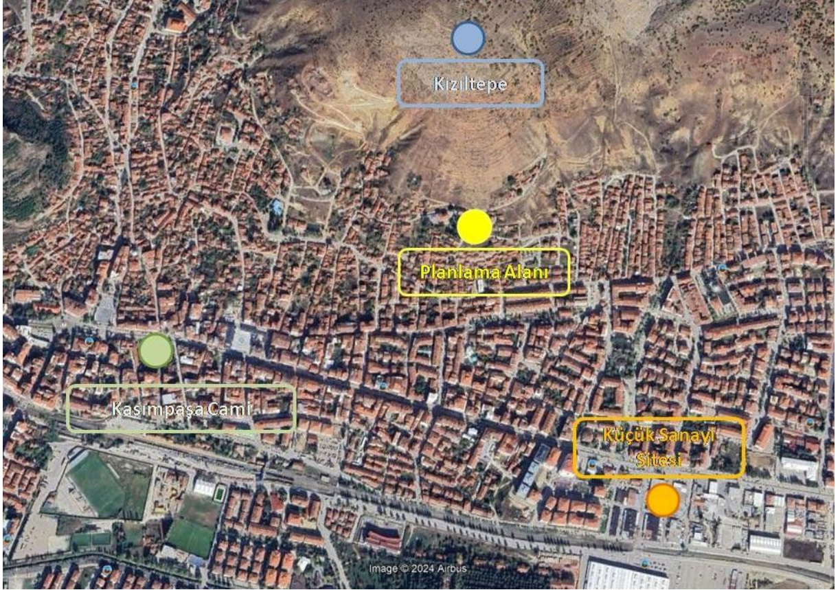
Şekil 1 Planlama alanının konumu

Planlama alanı, Kızıltepe'ye yakın bir konumda, Küçük Sanayi Sitesinin yaklaşık 660m kuzeybatısında, Kasımpaşa Camisinin yaklaşık 800m kuzeydoğusunda bulunmaktadır.