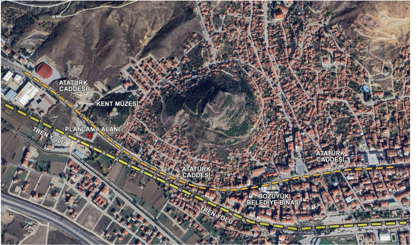
Şekil 1 Planlama alanının konumu

Planlama alanının kuzeyinde Atatürk Caddesi ve Kent Müzesi, güneyinde tren yolu, batısında spor salonu bulunmaktadır. Ayrıca önemli bir ana arter olan Atatürk Caddesinden cephe almakta ve Bozüyük Belediye Binasına ise 1 kilometre mesafede bulunmaktadır.