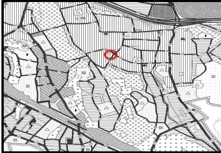
Şekil 2 21.08.2013 Tarihli ve 145 Sayılı 1/5000 Ölçekli İlave Revizyon Nazım İmar Planı Kararları

1/5000 Ölçekli Nazım İmar Planı'nda " az yoğun konut alanı " olarak planlıdır.