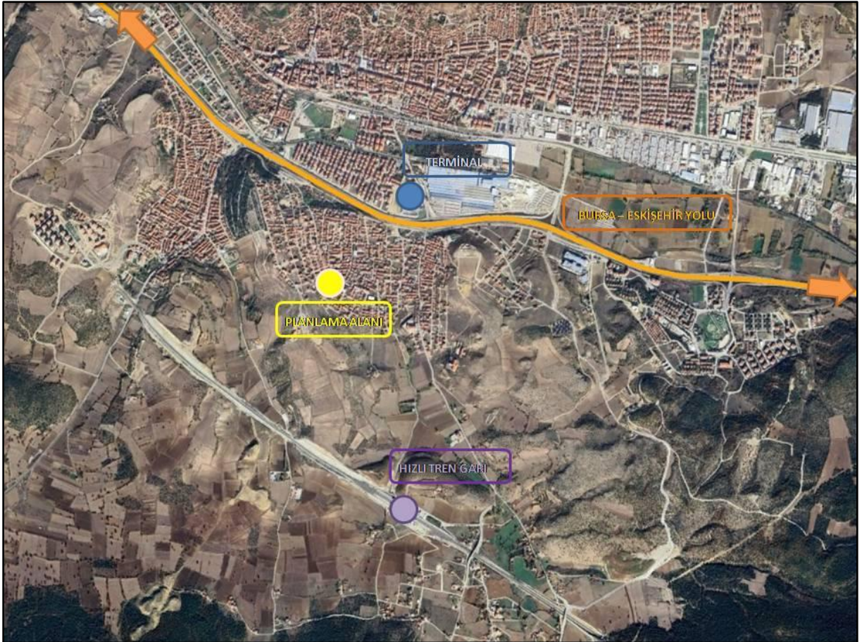
Şekil 1 Planlama Alanının Konumu

Planlama alanı, Bursa-Eskişehir yolunun yaklaşık 512 m güneyinde, Bozüyük hızlı tren garının yaklaşık 1500 m kuzeybatısında ve Bozüyük otobüs terminalinin 700 m güneybatısında, Kurtuluş Savaşı ve İnönü Zaferleri Anı Evi ve Seyir Terasının güneyinde konumlanmaktadır.